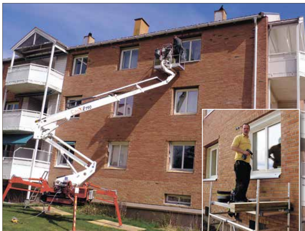
⤴ Til nå har ett arbeidslag (2 tømrere) og tre blikkenslagere vært i virksomhet. Blikkenslagere legger ny isolasjon og nye karmen utvendig på alle vinduer i borettslaget. Smart intensiveres arbeidet til 2 og 3 arbeidslag (4-6 personer).

Heldigvis er det bare gode tilbakemeldinger hittil.