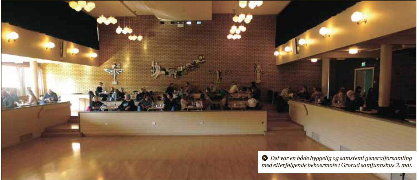
☺ Det var en både hyggelig og samstemt generalforsamling med etterfølgende beboermøte i Grorud samfunnshus 3. mai.

Rusken: I hele borettslaget er det kort til nærmeste søppelbøtte. Hjelp til å holde det pent, plukk opp rusk du finner på din vei!